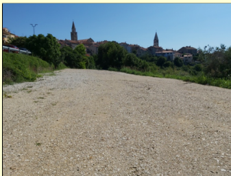
Prva parkirna platforma