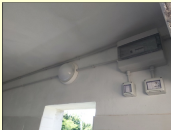
Električna instalacija u svlačionici