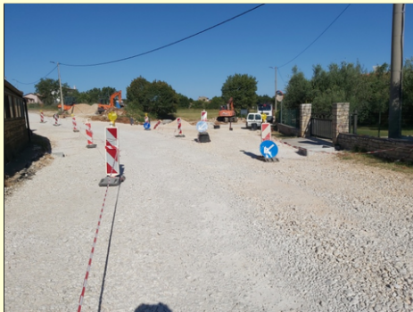
Radovi u tijeku