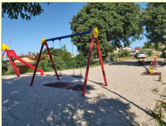
Dječje igralište u Gadarima