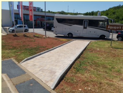
Novi pristup do SPAR trgovine