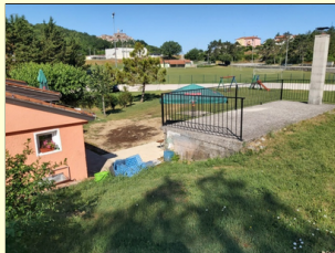
Uređenje okoliša TK Buje