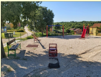
Dječje igralište u Gadarima