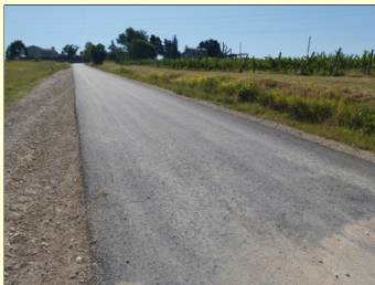
Dio ceste do Bracanije