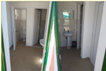
Nove sanitarije u TK Buje