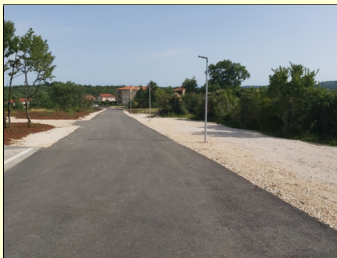
Cesta i javna rasvjeta