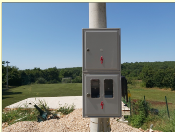
Ormarić sa priključcima za pučke manifestacije