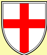
Grad Buje - Buie