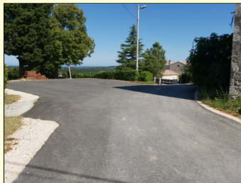
Bracanija - naselje