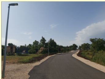
Cesta i javna rasvjeta